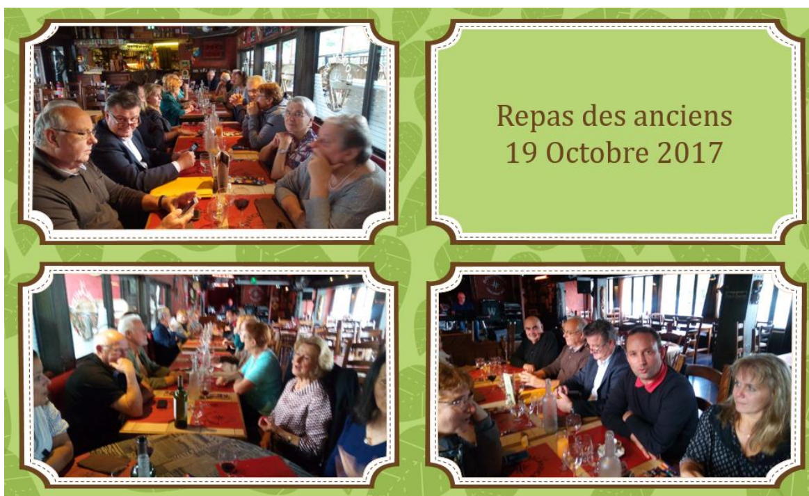
Repas des anciens 19 Octobre 2017

Soyons heureux d'être ensemble et sachons profiter agréablement de cette journée, comme le disait Jean Paul Sartres, « dans la vie on ne fait pas ce que l'on veut mais on est responsable de ce que l'on est ».