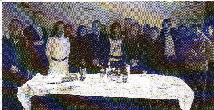
Le maire et ses administrés ont partagé de bonnes galettes.