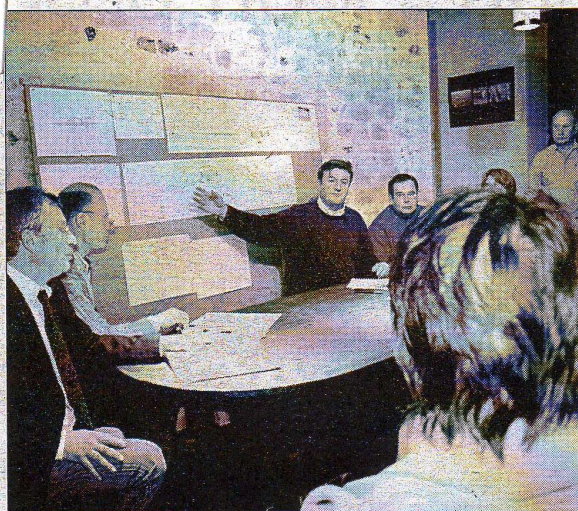
■ Les habitants se sont déplacés en masse pour parler de sécurité.