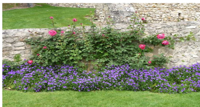
Un bon exemple

Les personnes intéressées y sont cordialement conviées.