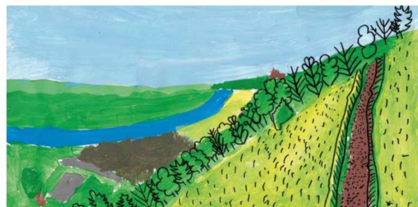
Les sentiers de la réserve naturelle à La Roche-Guyon vus par les élèves de l'école