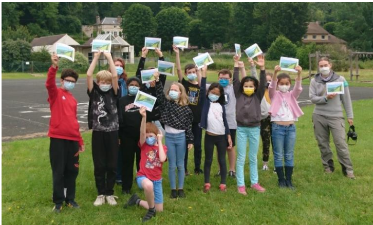
Les élèves avec la responsable de la réserve et l'animatrice du PNR

Des exemplaires de ce livret sont disponibles à l'espace nature Seine et Vexin au château de La ROCHE-GUYON et sur le site internet de notre commune également